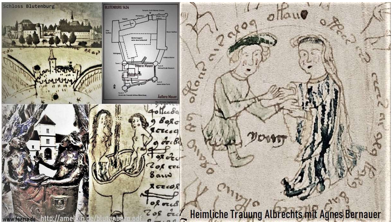
Das Voynich-Manuskript von Johannes Hartlieb: Schloss Blumenburg mit Wohnturm (1424-1425), Balneotherapie (warmes Bad), die heimliche Trauung Albrechts mit Agnes Bernauer (1423), verschlüsselte Zaubersprüche (z.B. Hexensalbenrezept " unguentum pharelis ": Eisenkraut, Mondraute, Einjähriges Bingelkraut, Donnerbart, Alraune, Frauenhaarfarn, Johanniskraut, Vogelblut, Tierschmalz und Zauberspruch " Sholdy doldy doldaiin dar dar dal ol ydaiin " - es kommt nicht auf die Aussprache, sondern auf die Lautfolge an)

The consciousness of a person (for example, a guest or a resident of the Blumenburg Castle) with its subsystems is a subsystem of the consciousness of the Blumenburg Castle, which is a subsystem of the Consciousness of the Universe with the creative possibility of exchanging information between all subsystems, including subsystems remained from the past. If a person masters the technologies of green fog (smog) and the systematic approach subalgorithm SOSSS ( stop - observe - smog - solution - step ), then it will be able to connect to any subsystem of consciousness and self-consciousness (for example, the Blumenburg Castle) and to solve any problems. The formation of special cultural and creative skills allows a person unlimitedly to develop its extrasomatic pampsy-structure of consciousness and self-consciousness connected with the Consciousness and the Long-term Memory of the Universe.