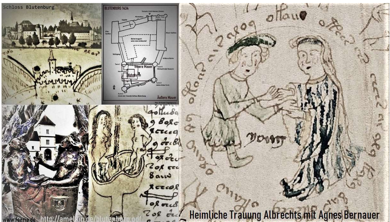
Heimliche Trauung Albrechts mit Agnes Bernauer

The consciousness of a person (for example, a guest or a resident of the Blumenburg Castle) with its subsystems is a subsystem of the consciousness of the Blumenburg Castle, which is a subsystem of the Consciousness of the Universe with the creative possibility of exchanging information between all subsystems, including subsystems remained from the past. If a person masters the technologies of green fog (smog) and the systematic approach subalgorithm SOSSS ( stop - observe - smog - solution - step ), then it will be able to connect to any subsystem of consciousness and self-consciousness (for example, the Blumenburg Castle) and to solve any problems. The formation of special cultural and creative skills allows a person unlimitedly to develop its extrasomatic pampsy-structure of consciousness and self-consciousness connected with the Consciousness and the Long-term Memory of the Universe.